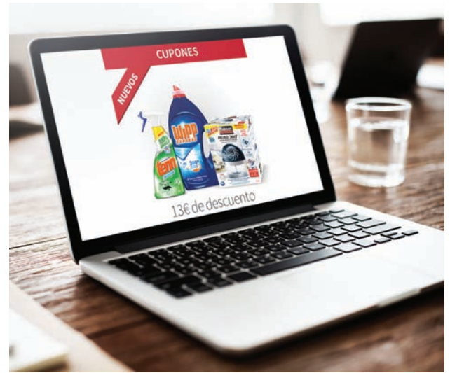
Branded Landing Pages con cupones

Sobre una base de 40 años de experiencia, la solución Print@Home de Valassis hace posible que quienes deseen generar cupones puedan producirlos de acuerdo a los formatos aceptados por los puntos de venta; seleccionar los puntos de contacto como el móvil, página web, redes sociales, email o blogs a lo largo del recorrido del cliente durante la compra; y establecer niveles apropiados de seguridad y límites de impresión. El servicio Print@Home de Valassis genera millones de impresiones al año en Italia, Alemania, Reino Unido y España.